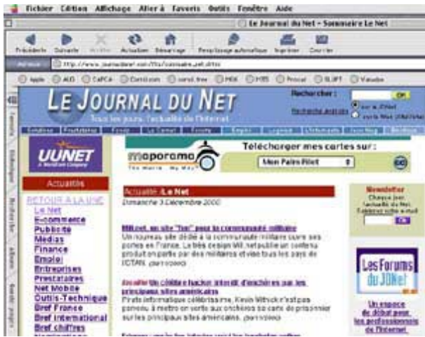
Le Journal du Net.